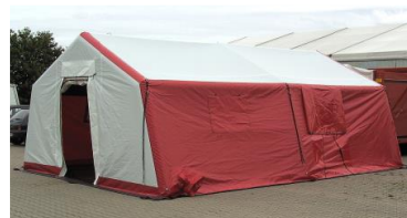
LGZ-L sátor, opcionális oldalajtóval