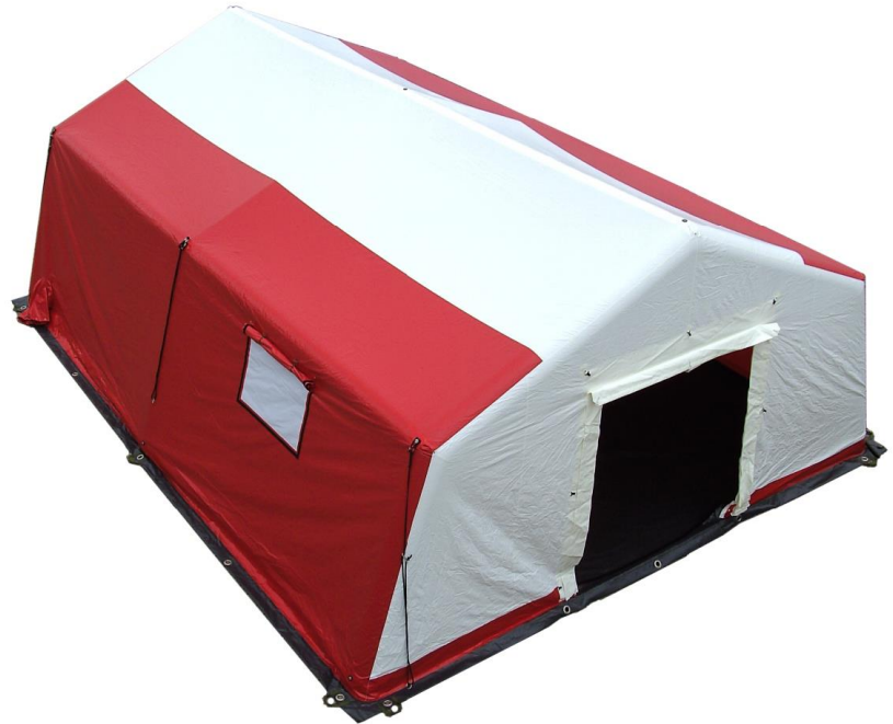
pneumatikus sátor (LGZ-L típus)

sátrak egymással összekapcsolása lehetséges