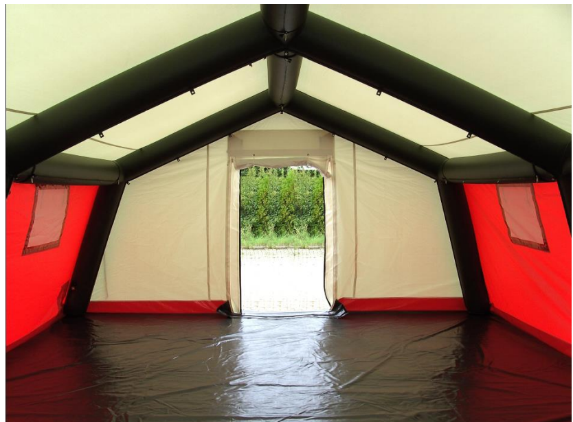
LGZ-L sátor belső tere

sem szerszám, sem létra nem szükséges a telepítéshez