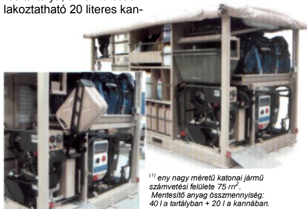
(1) eny nagy méretű katonai jármű számvetési felülete 75 m 2 . Mentesítő anyag össz mennyiség: 40 l a tartályban + 20 l a kánában.