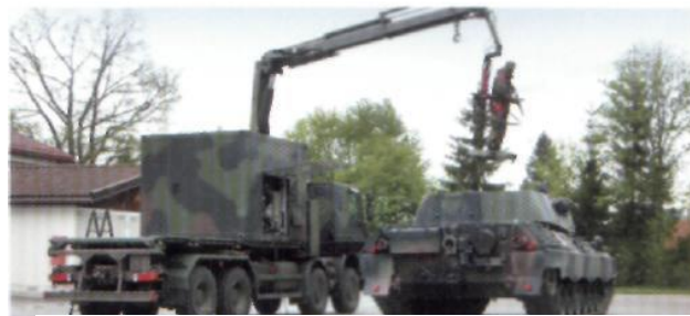
Az AMGDS 2000 önálló alkalmazású vagy mentesítő rendszerbe integrált modulként lett tervezve