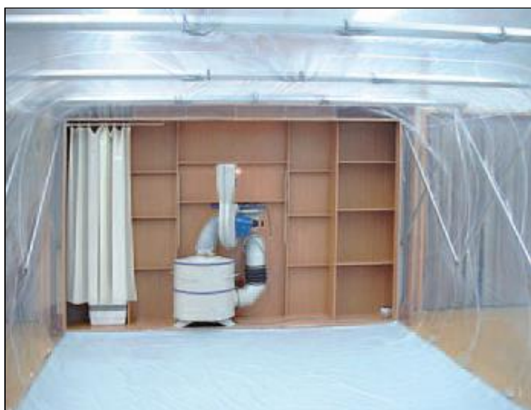
NA 3570 típusú fülke belső nézete