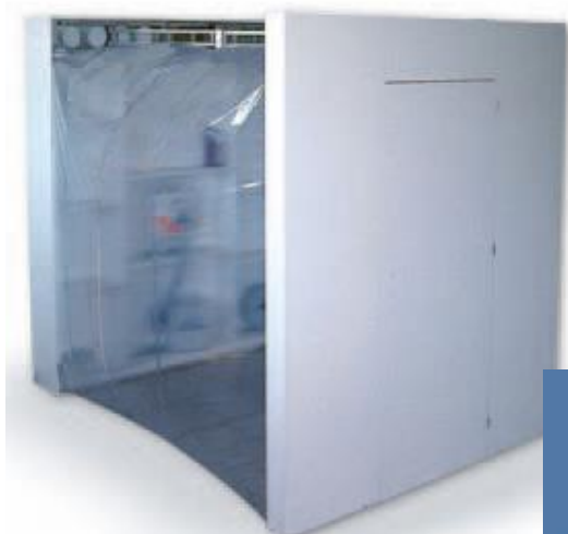
NA 2023 Beltéri fix telepítésű ABV védett fülke